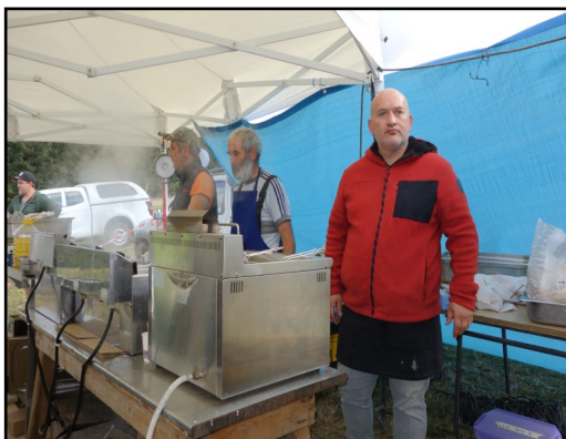
A la bonne frite....