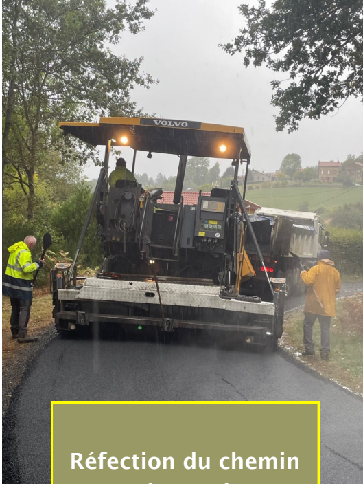
Réfection du chemin de Parel

Nous avons tous constaté les importants travaux de débroussaillage et d'éparage effectués par le conseil départemental sur le tracé de la spéciale organisée le 14 octobre pour la finale de la coupe de France des rallyes automobiles.