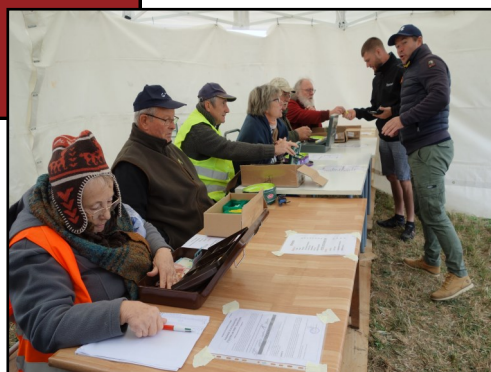
Sérieux et concentration aux caisses